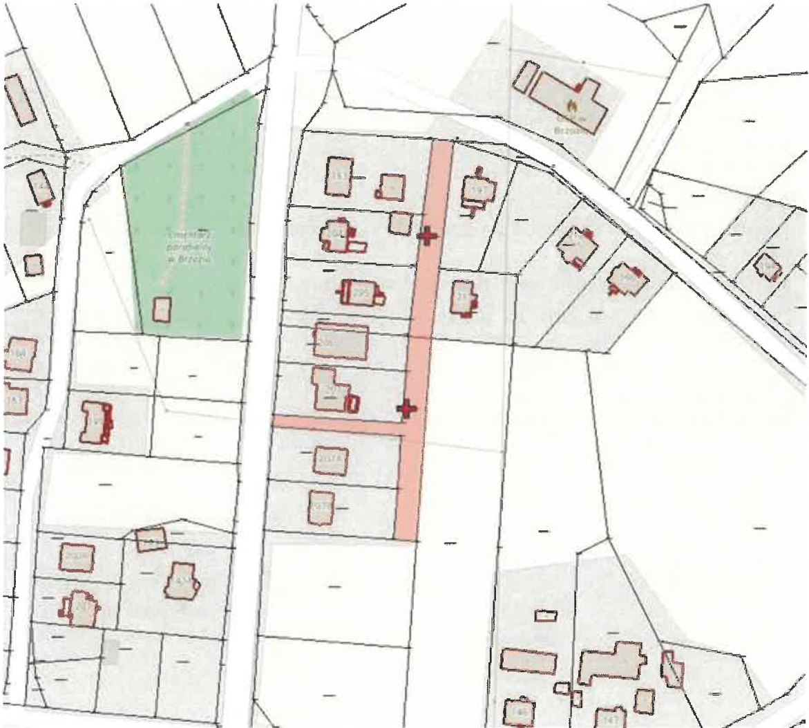
Droga wewnętrzna proponowana do zaliczenia do kategorii dróg gminnych w Gminie Brzozie